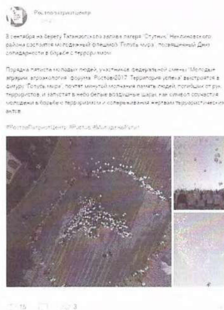
Рисунок 6 – Информация о предстоящем мероприятии в социальной сети «ВКонтакте»

Иллюстративным примером можно привести акцию памяти «Голубь мира», проведенную Ростовпатриотцентром в 2017 году. В сети Интернет была размещена анонсирующая информация (см. рисунок 6).