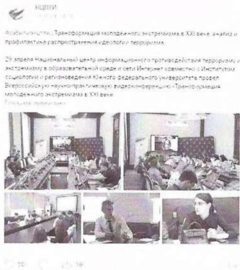
Рисунок 12 – Информация о прошедшем мероприятии