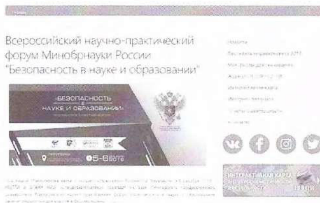
Рисунок 2 – Краткий пресс-релиз

Краткий пресс-релиз обычно содержит информацию с приглашением посетить мероприятие, зарегистрироваться или получить аккредитацию для представителей СМИ. Пример размещенного пресс-релиза продемонстрирован на рисунке 2.