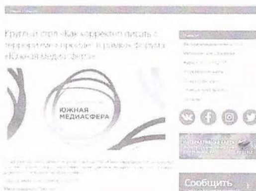
Рисунок 9 – Информация о предстоящем мероприятии

Данный пункт можно проиллюстрировать мероприятием – Круглый стол «Как корректно писать о терроризме», который прошел в рамках форума «Южная медиасфера» (см рисунок 9).