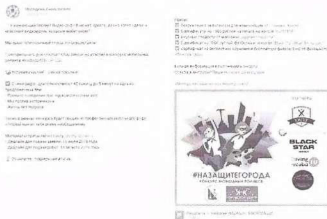
Рисунок 1 – Анонс мероприятия в социальной сети

В анонсе должна содержаться информация, разъясняющая что, где, когда и кем проводится. Данные могут предоставляться дозированно, обязательный элемент – наличие прямых контактов организаторов (см. рисунок 1).