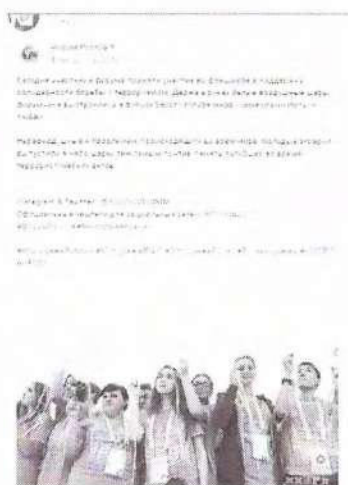
Рисунок 7 – Информация о проходящем мероприятии в социальной сети «ВКонтакте»

Видеоматериал как один из результатов состоявшейся акции был распространен через отдельную публикацию (см. рисунок 8).