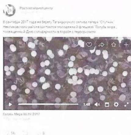
Рисунок 8 – Информация о прошедшем мероприятии в социальной сети «ВКонтакте»

Видеоматериал как один из результатов состоявшейся акции был распространен через отдельную публикацию (см. рисунок 8).