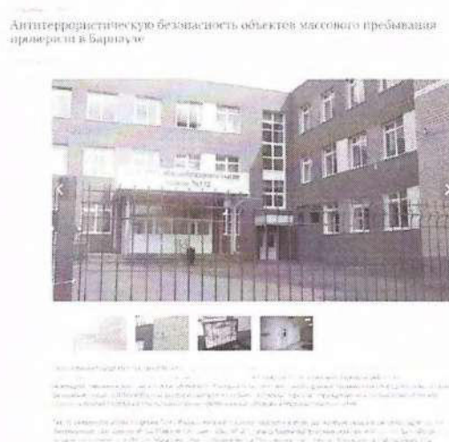
Рисунок 11– Информация о прошедшем мероприятии

Другой пример – мероприятие по мониторингу обеспечения антитеррористической безопасности объектов массового пребывания в г. Барнаул (см. рисунок 11).