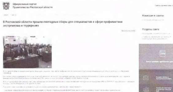
Рисунок 10 – Информация о прошедшем мероприятии

Иллюстрацией информационного освещения мероприятий такого рода является проведение ежегодных сборов для специалистов, организованных Антитеррористической комиссией Ростовской области. В новостной публикации сообщается, что ключевой темой встречи было обсуждение принятого Комплексного плана–2023, также в программу сборов входили лекции представителей силовых ведомств, регионального министерства образования и департамента потребительского рынка (см. рисунок 10).